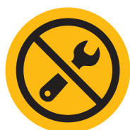
KEINE TÄGLICHE WARTUNG