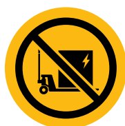
KEIN AUFLADEN VON AKKUS